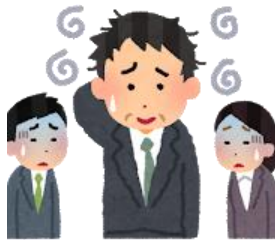
新人の育成法などを知らない上司