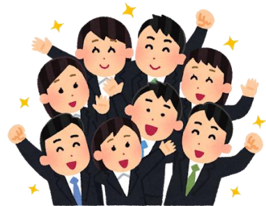
チーム力向上→成果向上ができる上司