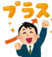
新人や慣れない部下を戦力化できる上司