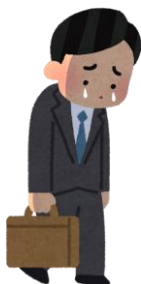
打つ手が空回りで未達続きの上司