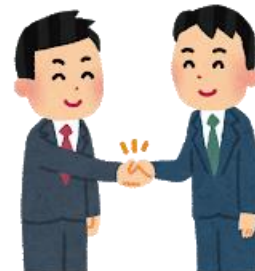
効果的な問題解決策が打てる上司